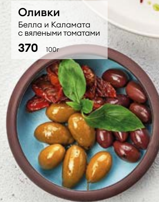
Оливки Белла и Каламата с вялеными томатами 370 100г