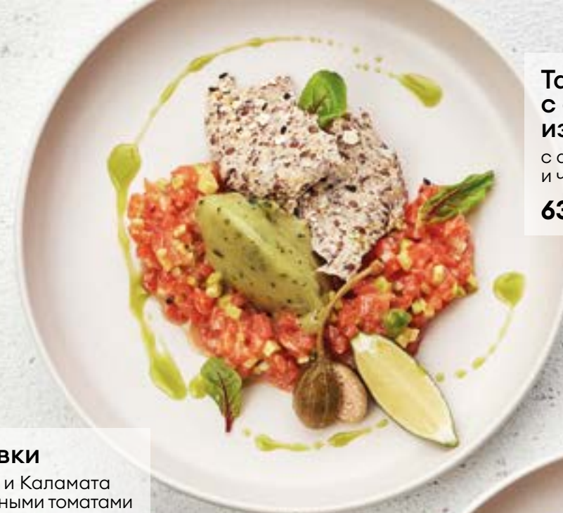
Тартар из лосося с сорбетом из груши и кинзы с авокадо, огурцом и чипсами из льна 630 150г