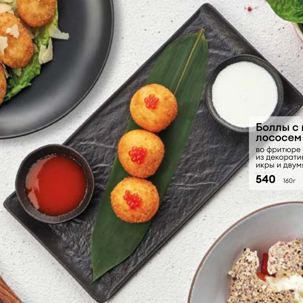
Боллы с креветками, лососем и рикоттой во фритюре с шапкой из декоративной красной икры и двумя соусами 540 160г