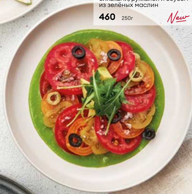
Карпаччо из спелых и маринованных томатов с авокадо, маслинами, оливками, рукколой и соусом из зелёных маслин 460 250г New