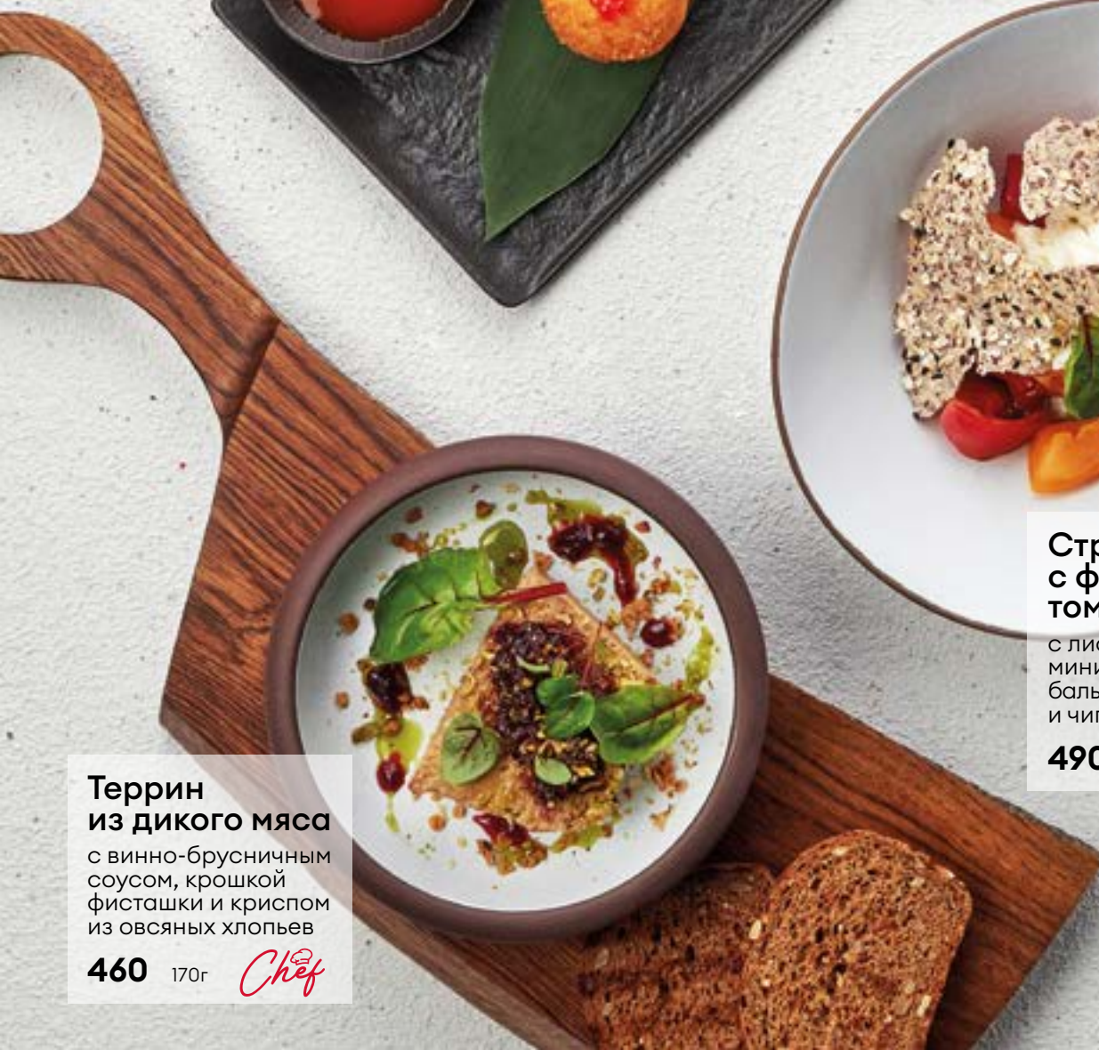
Террин из дикого мяса с винно-брусничным соусом, крошкой фисташки и крипом из овсяных хлопьев 460 170г Chef