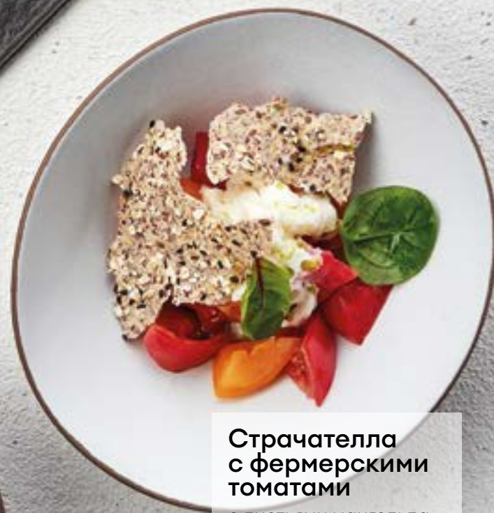
Страчателла с фермерскими томатами с листьями мангольда, мини-шпинатом, бальзамическим кремом и чипсами из льна 490 220г Hit