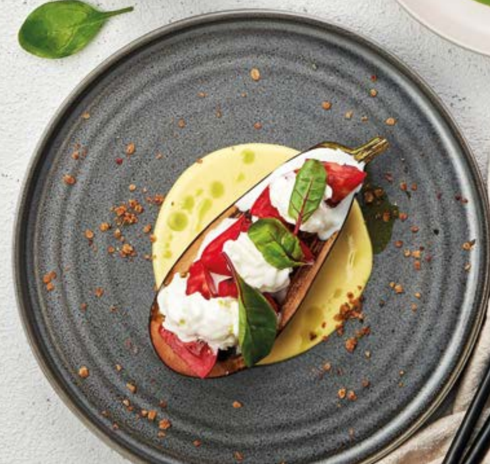
Баклажан с трюфельной страчателлой и розовыми томатами с листьями мангольда, мини-шпинатом и сырным соусом 560 290г Hit