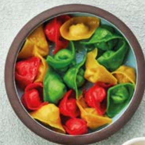
Цветные пельмешки с куриным филе и сметаной 310 230/20г