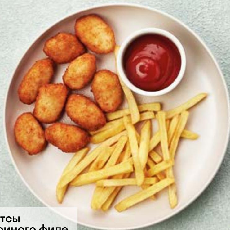
Наггетсы из куриного филе подаются с картофелем фри и кетчупом 360 230г