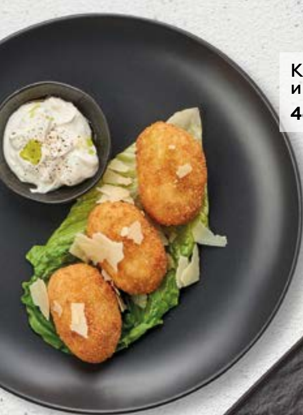
Крокеты с сыром и куриным филе 460 190г