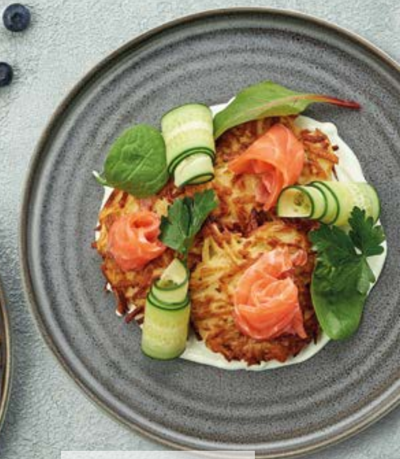
Картофельные оладьи с лососем и фермерской зеленью 490 310г